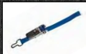
Sangle de tension avec cliquet côté enroulement