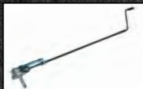
1 ou 2 Manivelles manuelles d'enroulement