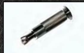
Piton douilles Alu Inox